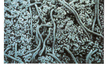
プラークの電子顕微鏡写真

プラークは口の中の清掃が十分になされていない歯の表面に形成されます。歯以外にも清掃が不十分な入れ歯（義歯）や舌の表面などにも付着します。