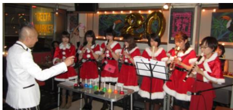
スタッフによるリコーダー演奏♪ ハンドベル演奏も大成功でした！