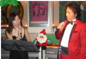
アウローラのお二人♪ ステキな歌声で、オープニングを飾って頂きました。